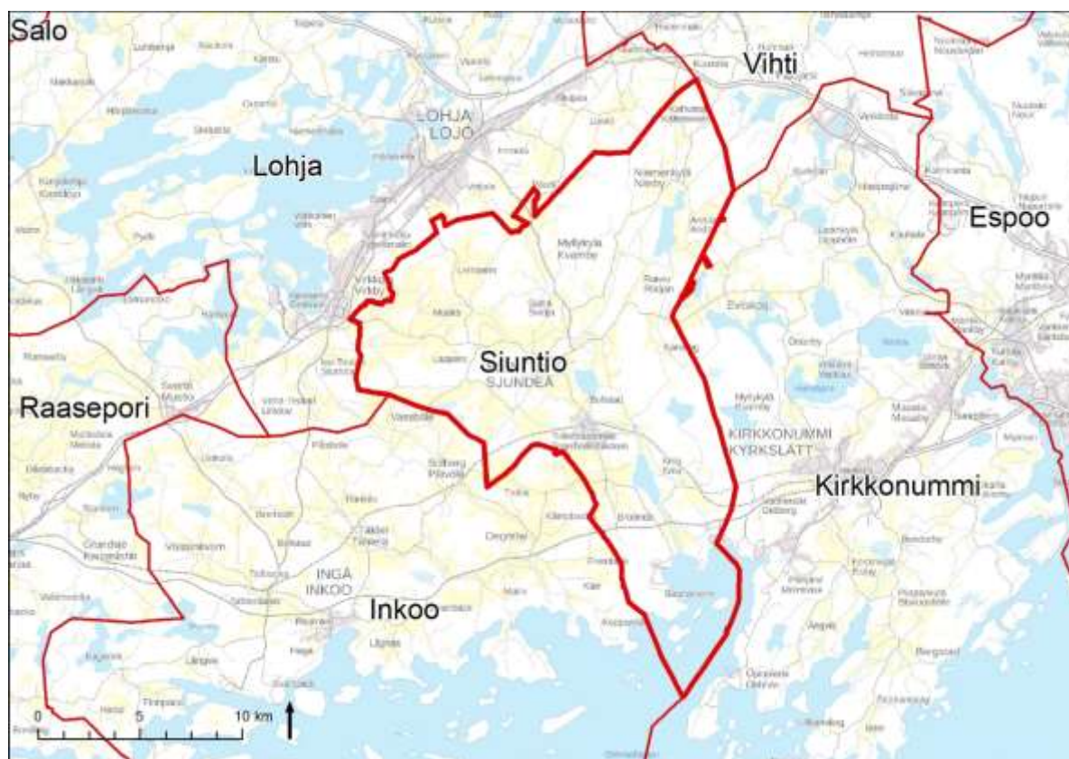
Kuva 7.1. Kaava-alueen sijainti (paksu punainen raja).