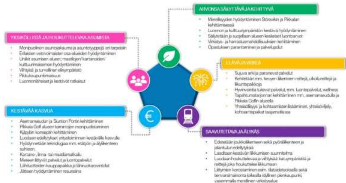
Kuva 1. Siuntion maankäytön kehityskuvan päivityksessä 2040 tunnistettuja kehittämistavoitteita.

Strategista yleiskaavatyötä pohjustaa Siuntion maankäytön kehityskuvan päivitys 2040 (KV 7.6.2021 § 50). Strategisessa yleiskaavassa konkretisoidaan, miten kehityskuvassa ja muissa suunnitelmissa esitetyt periaatteet viedään käytännön toiminnan tasolle. Lisäksi konkretisoidaan, mitä maankäyttöön, asumiseen ja liikenteeseen liittyviä kysymyksiä kunnan tulee ratkaista, jotta kunnan kehitystä voidaan ohjata tavoitteiden mukaiseen suuntaan tulevaisuudessa.