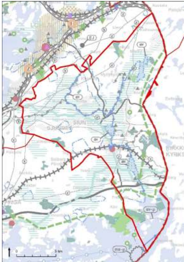
Kuva 8.3. Ote Länsi-Uudenmaan vaihemaakuntakaavasta. Kuntarajat on lisätty punaisella ja Siuntio pak-sulla punaisella viivalla (hyväksytty maakuntavaltuustossa 25.8.2020)